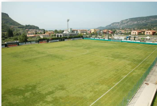
Natur Rasenplatz Garda